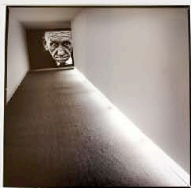
1. Saria 2009 PORTILLO, Endika "Pasillo"