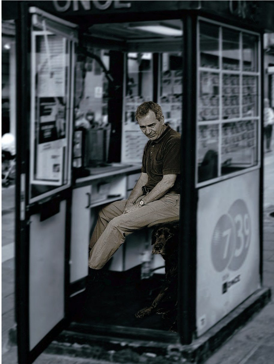
Egilea / Autor / Author / Auteur: JUAN ANTONIO UNZURRUNZAGA POSADA (Bergara - Gipuzkoa) Spain Goiburua / Titulo / Caption / Titre: "Siempre con mi amigo"