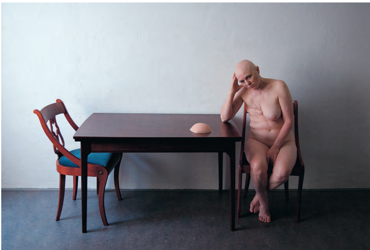
Egilea / Autor / Author / Auteur: KLAAS P. SCHIPPER (Enschede) Holanda Goiburua / Título / Caption / Titre: "To have or not to have" Lehen Saria / Primer Premio / First Prize / Premier Prix