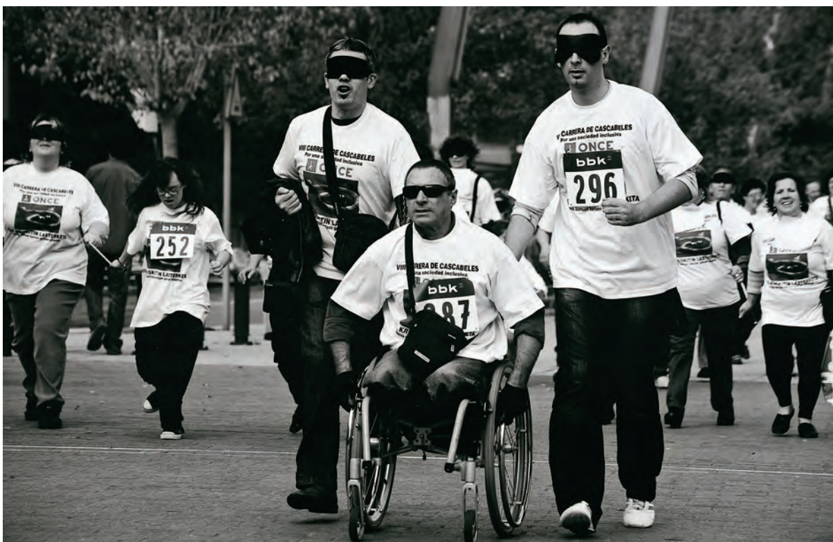
Egilea / Autor / Author / Auteur: JUAN TORRE MOLLINEDO (Getxo - Bizkaia) Spain Goiburua / Título / Caption / Titre: ¡¡Vamos!! ONCE-ko Bazkideen arteko accesita / Accésit afiliado a la ONCE Consolation prize affiliated to the ONCE / Accessit affilié à la ONCE