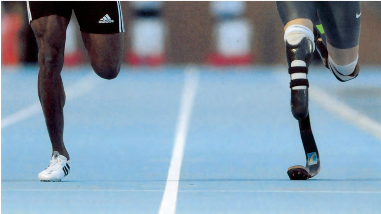
Egilea / Autor / Author / Auteur: VANNI STROPPIANA (Rivoli) Italia Goiburua / Titolo / Caption / Titre: "To the finish"