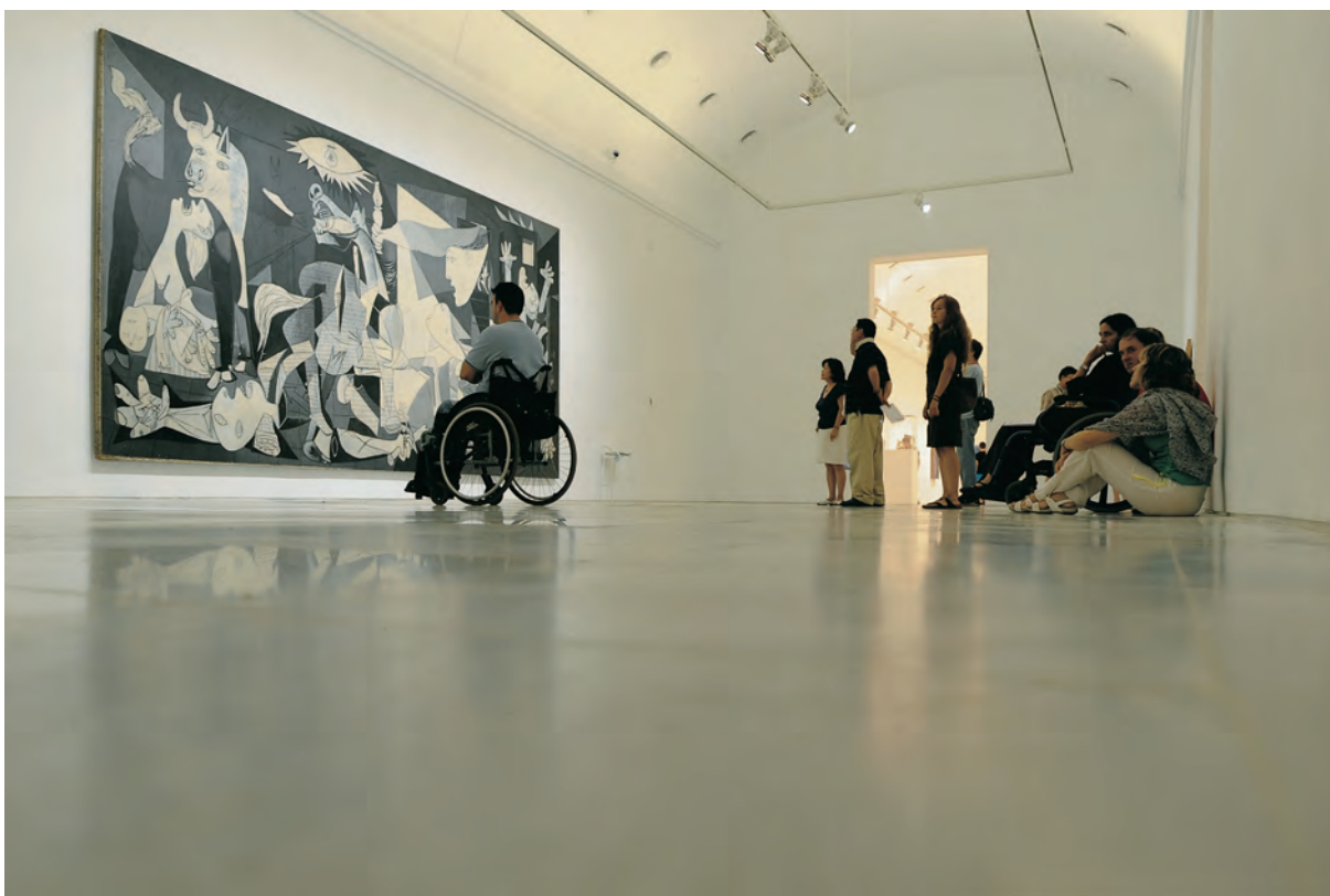
Egilea / Autor / Author / Auteur: ANTONIO JESÚS PÉREZ GIL (Sevilla) Spain Goiburua / Título / Caption / Titre: “Pensando con el Gernika”