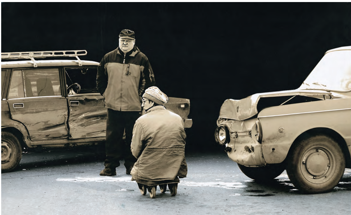
Egilea / Autor / Author / Auteur: VIKTOR SILNOV (Penza) Rusia Goiburua / Titolo / Caption / Titre: "Opposition"