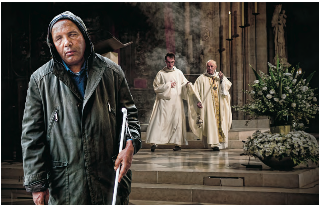
Egilea / Autor / Author / Auteur: MANUEL LOPEZ PUERMA (Alicante) Spain Goiburua / Título / Caption / Titre: "Misa en Notre Dame"