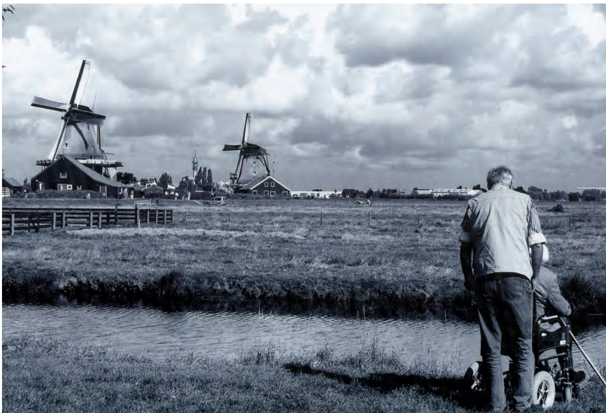
Egilea / Autor / Author / Auteur: GUILLEN MORERA PEIRÓ (Terrassa - Barcelona) Spain Goiburua / Titulo / Caption / Titre: “Objetivo alcanzado: Ver los molinos de Zaanse Schans” Minusbaliatuei zuzenduriko accesita / Accésit discapacitado Disabled person consolation prize / Accessit personne handicapée