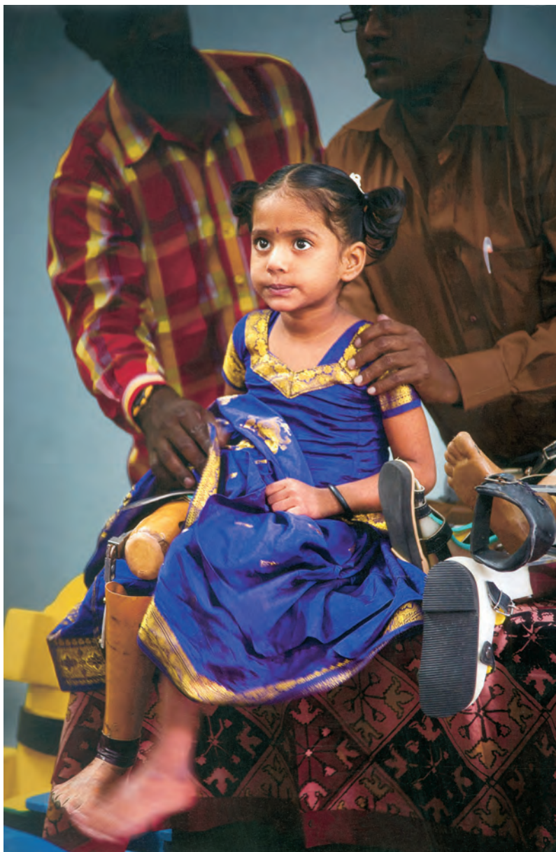
Egilea / Autor / Author / Auteur: JAVI MUÑOZ (Muxica - Bizkaia) Spain Goiburua / Título / Caption / Titre: Titulo: "Prótesis salvadora"