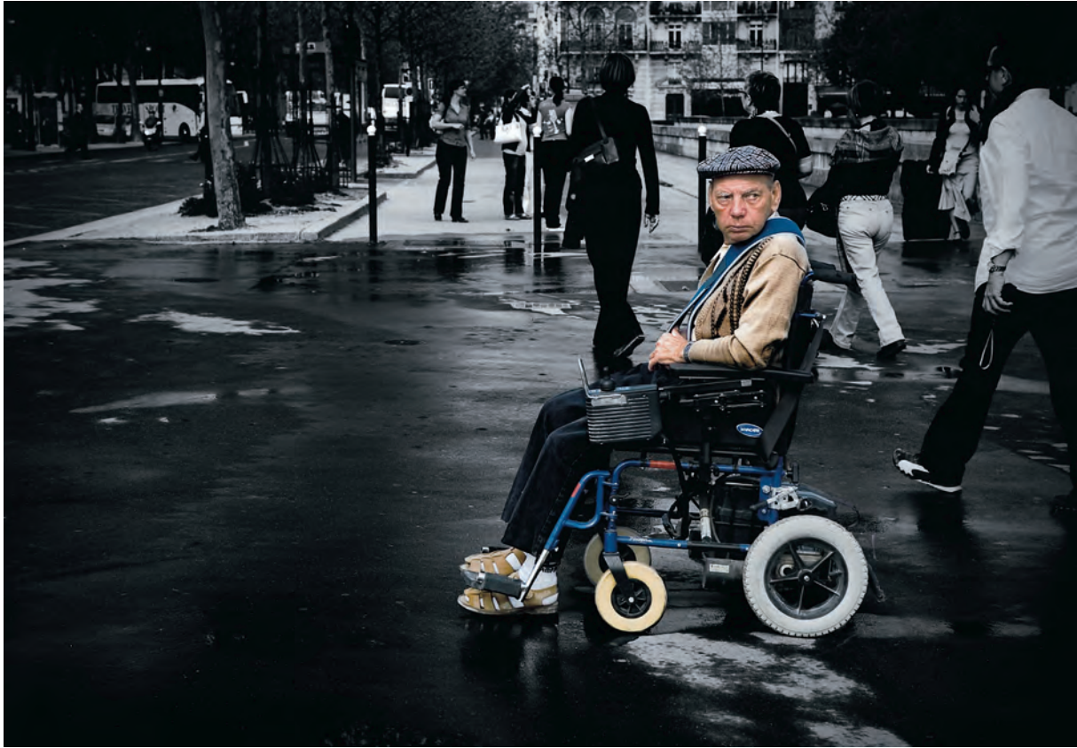
Egilea / Autor / Author / Auteur: MANUEL LOPEZ PUERMA (Alicante) Spain Goiburua / Titulo / Caption / Titre: "Silla"