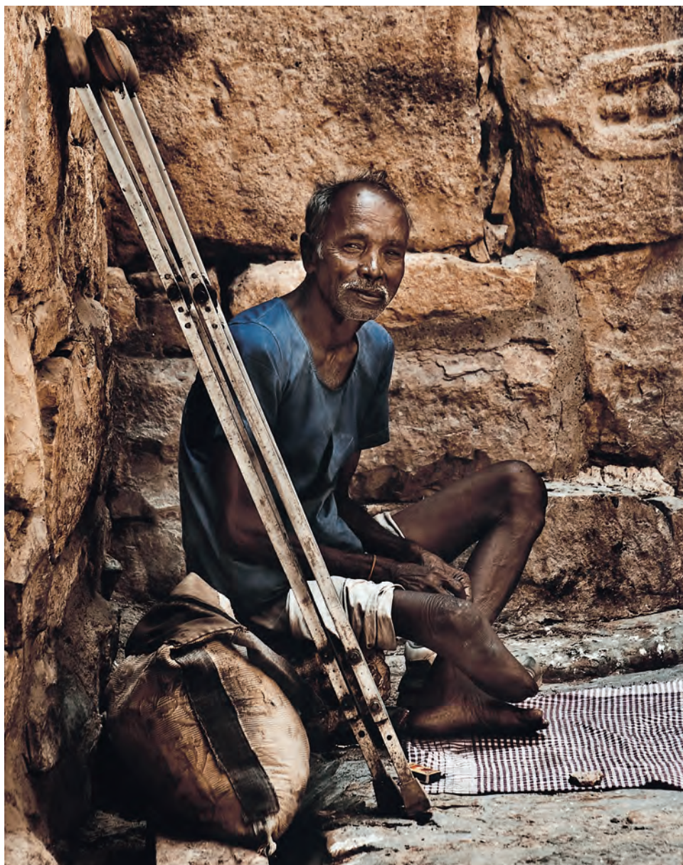
Egilea / Autor / Author / Auteur: MARIANO LÓPEZ GALLEGA (Barcelona) Spain Goiburua / Titulo / Caption / Titre: "Iguales para hoy"