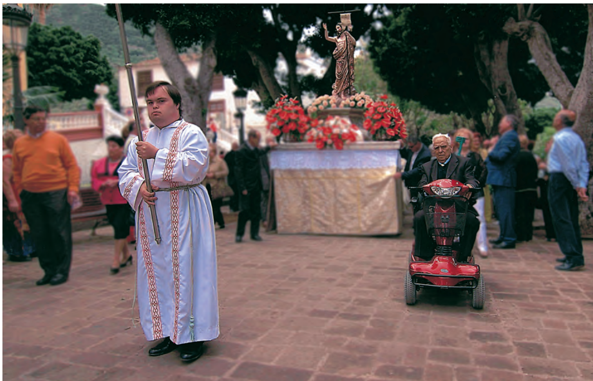
Egilea / Autor / Author / Auteur: JUAN ANTONIO UNZURRUNZAGA POSADA (Bergara - Gipuzkoa) Spain Goiburua / Titulo / Caption / Titre: “Como uno más”