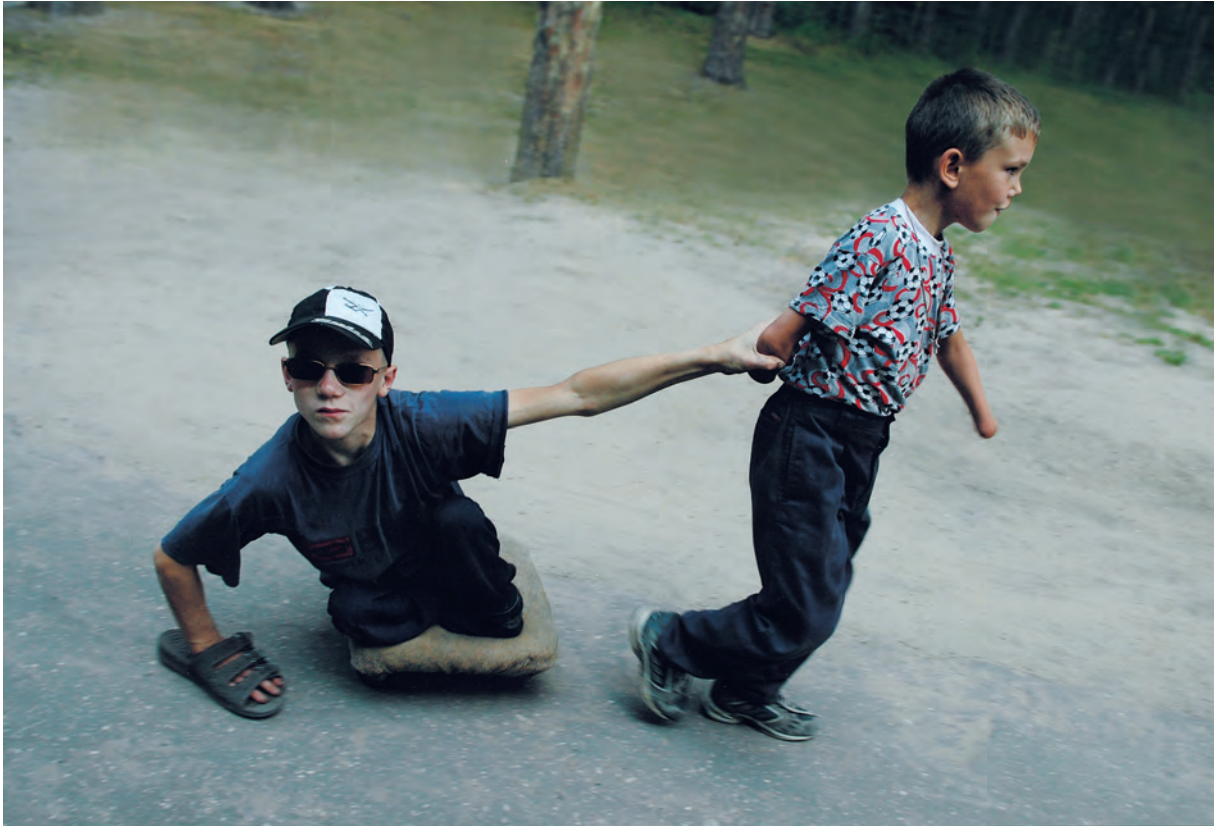
Egilea / Autor / Author / Auteur: VIKTOR SILNOV (Penza) Rusia Goiburua / Titulo / Caption / Titre: “Together it’s easier”