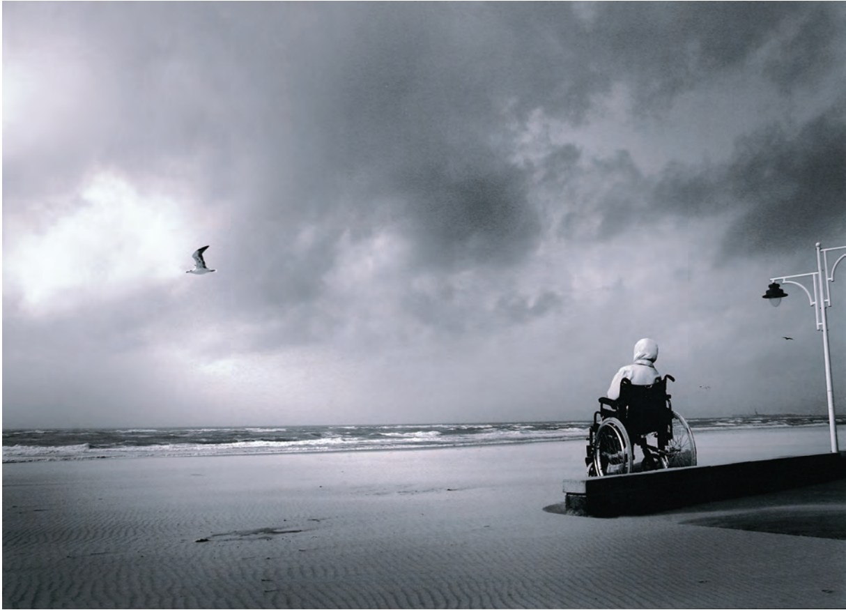
Egilea / Autor / Author / Auteur: JUANI RAGEL ROPERO (Algeciras - Cadiz) Spain Goiburua / Título / Caption / Titre: "Superación 2"