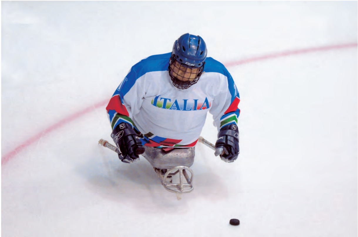
Egilea / Autor / Author / Auteur: VANNI STROPPIANA (Rivoli) Italia Goiburua / Título / Caption / Titre: "Okay wheels 7441"