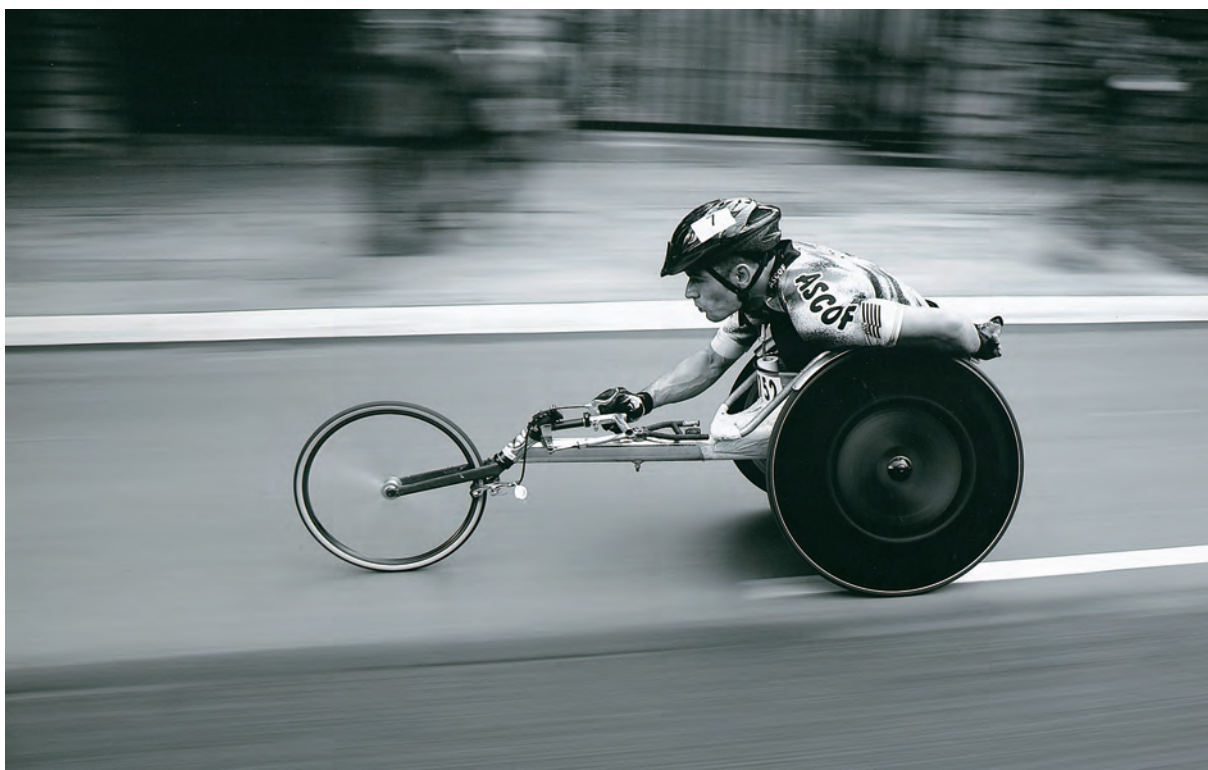
Egilea / Autor / Author / Auteur: IÑAKI ETXENAGUSIA UNANUE (Azpeitia - Gipuzkoa) Spain Goiburua / Titolo / Caption / Titre: "Ina 1"