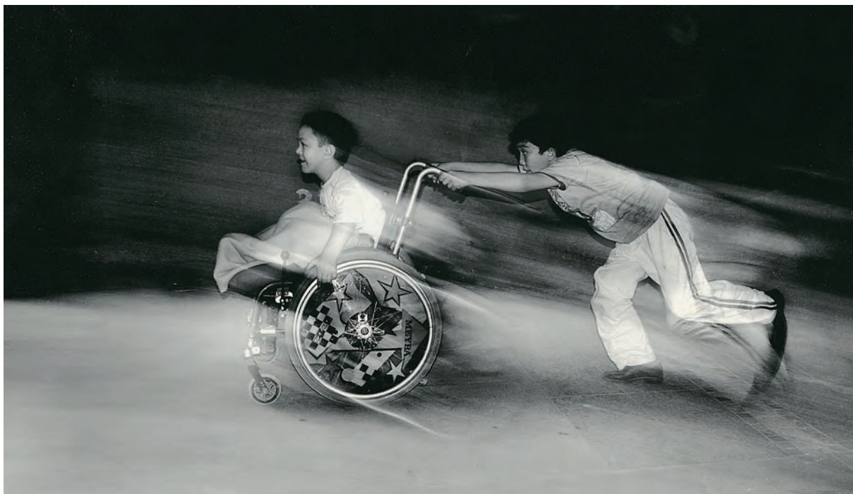
Egilea / Autor / Author / Auteur: AHMET REMZI TŪLŪCE (Kocaeli) Turquia Goiburua / Titulo / Caption / Titre: "Trip" Hirugarren Saria / Tercer Premio / Third Prize / Troisième Prix