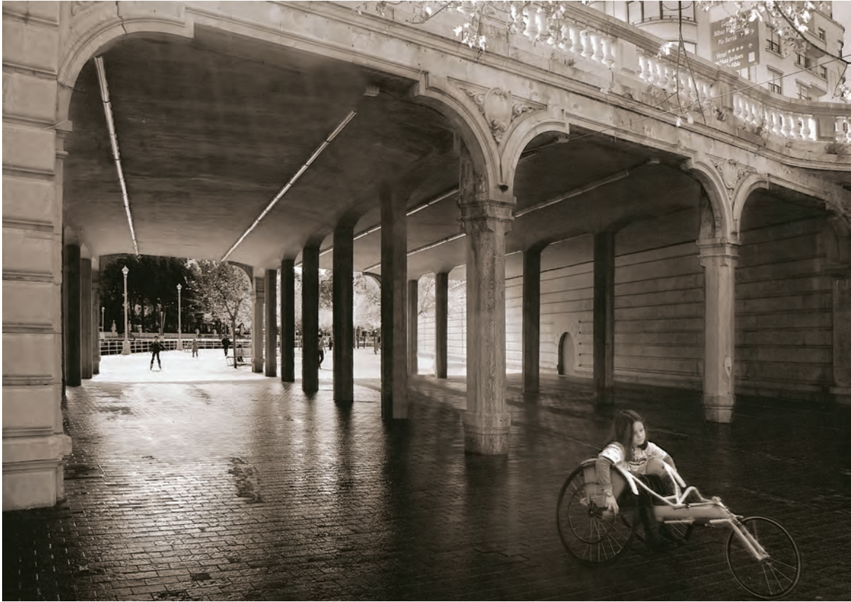
Egilea / Autor / Author / Auteur: KOLDO GÁLVEZ VIGUERA (Bilbao) Spain Goiburua / Título / Caption / Titre: "Soledad"