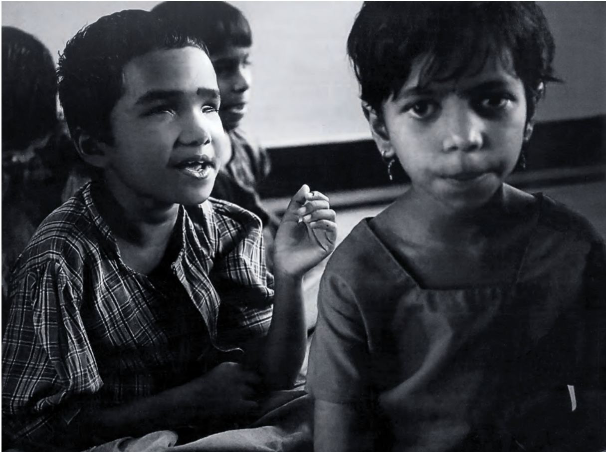
Egilea / Autor / Author / Auteur: JAVIER MUÑOZ (Muxica - Bizkaia) Spain Goiburua / Título / Caption / Titre: "Sin título" Bigarren Saria /Segundo Premio / Second Prize / Deuxième Prix Euskal Herriko Lehen Argazkilaria / Primer Fotógrafo del País Vasco First Photograph of the Basque Country / Premier Photographe du Pays Basque