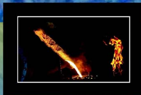
Título de la foto: "Luces y sombras" Autor: Asier Camacho Fernández