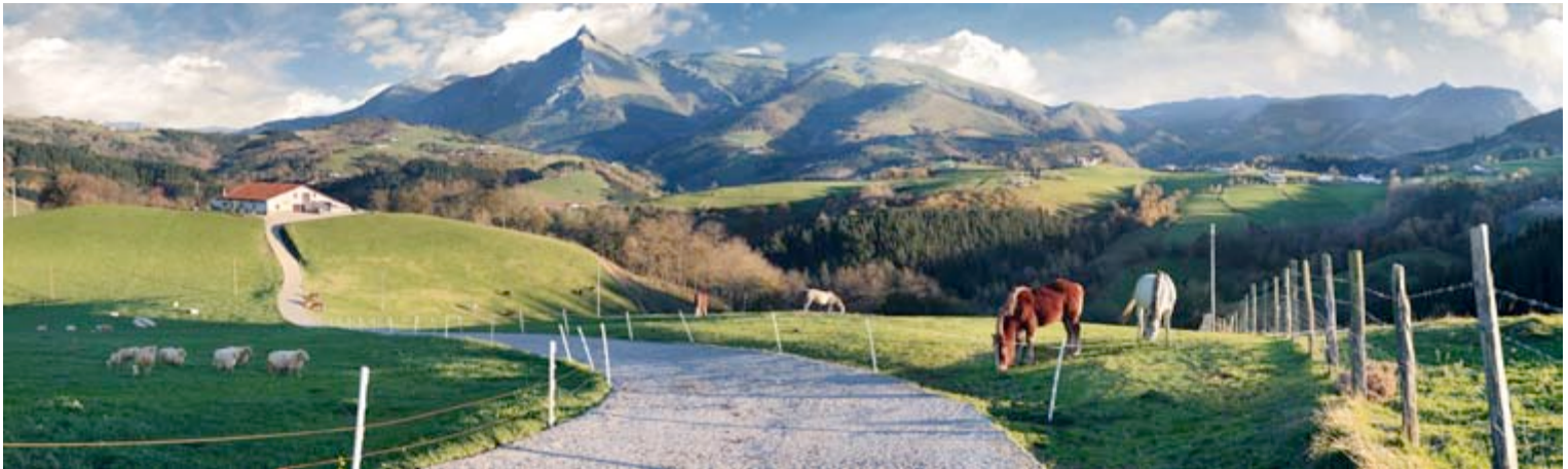
Monte Txindoki. Goierri..

Ordutegia/Horario: Martes a domingo de de 18:30-20:30h