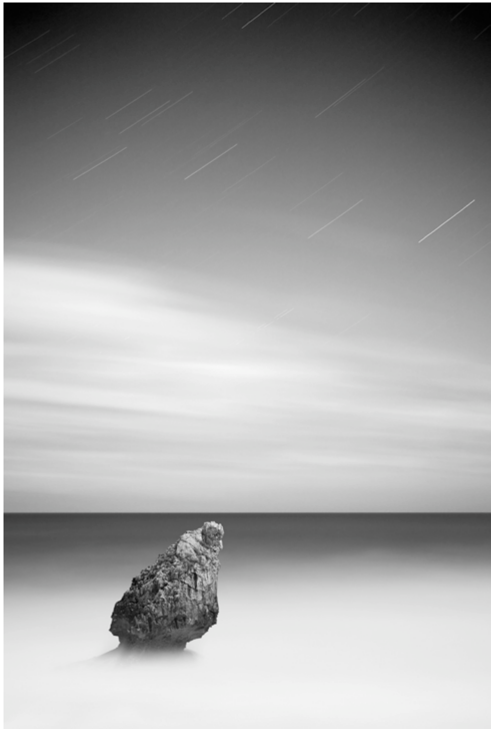
egilea/autora: ISABEL DIEZ

El Trofeo Argizaiola es el concurso de los ganadores de concursos de Euskadi, organizado por la Federación de Agrupaciones Fotográficas del País Vasco.