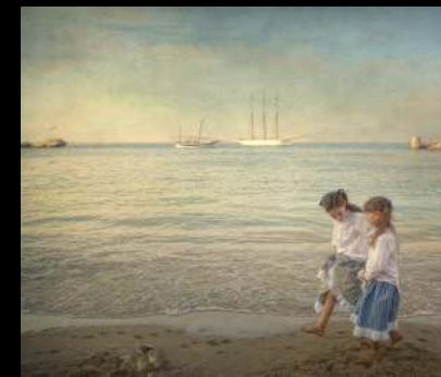
Argazkia: Les nines de la mar - Pili Garcia Pitarch