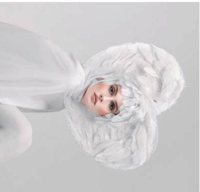
“HEART-SHAPED WING”, YI DU TXINATARRAREN ARGAZKI IRABAZLEA.

aportadas entre las tres secciones: color, mocromo y fotografía de viaje. La exposición reúne una selección de 35 fotografías, de entre las 59 galardonadas. Esta exposición es una pequeña muestra del gran talento y la sensibilidad captada por los fotógrafos presentados en esta 51 edición.