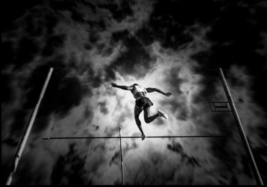
Argazkia: Tampoco - Joxemi Romero Barco