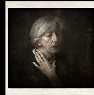
Argazkia: Requiem II - Andres Indurain Gutierrez